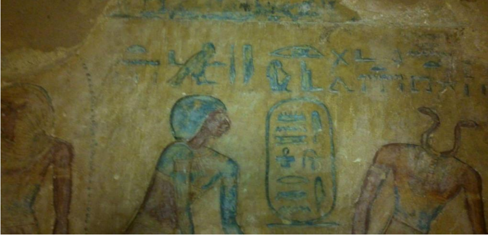
صورة لأحد النقوش لمقبرة أسركون من الداخل