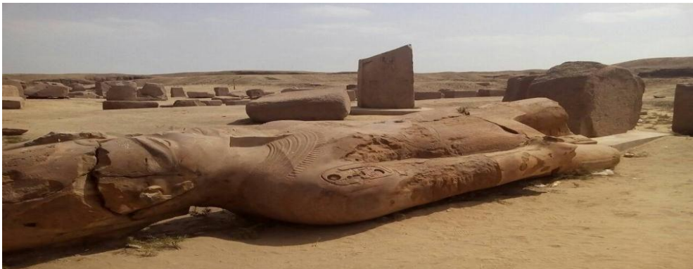
تماثيل الملك رمسيس الثاني