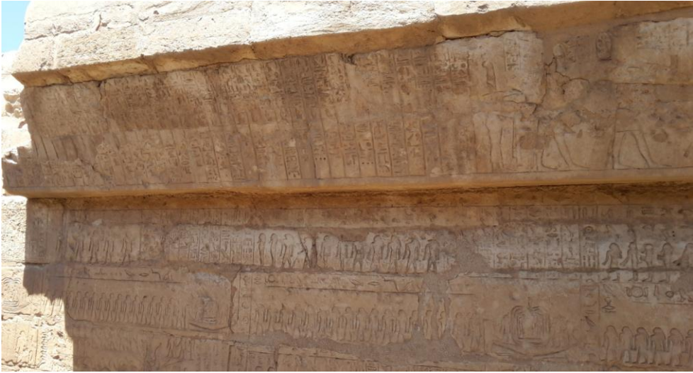
صورة لأحد النقوش لمقبرة شاهنق الثالث