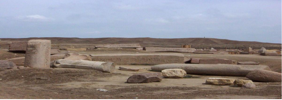
بقايا المسلات والأعمدة