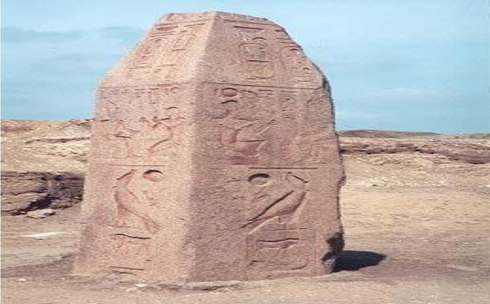
جزء من أحد المسلات القديمة التي كانت موجودة بتانيس